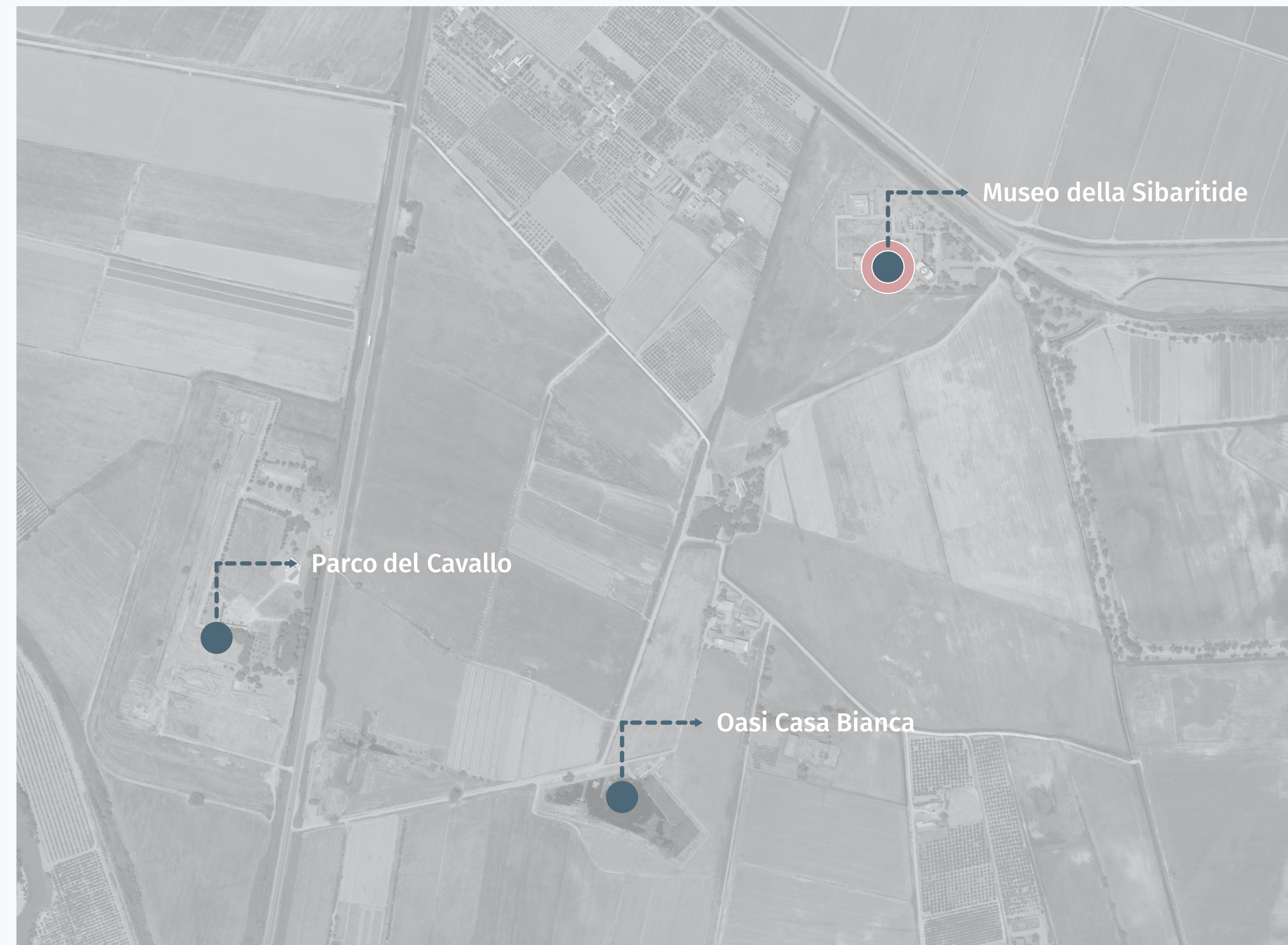
Inquadramento territoriale scala 1:5000