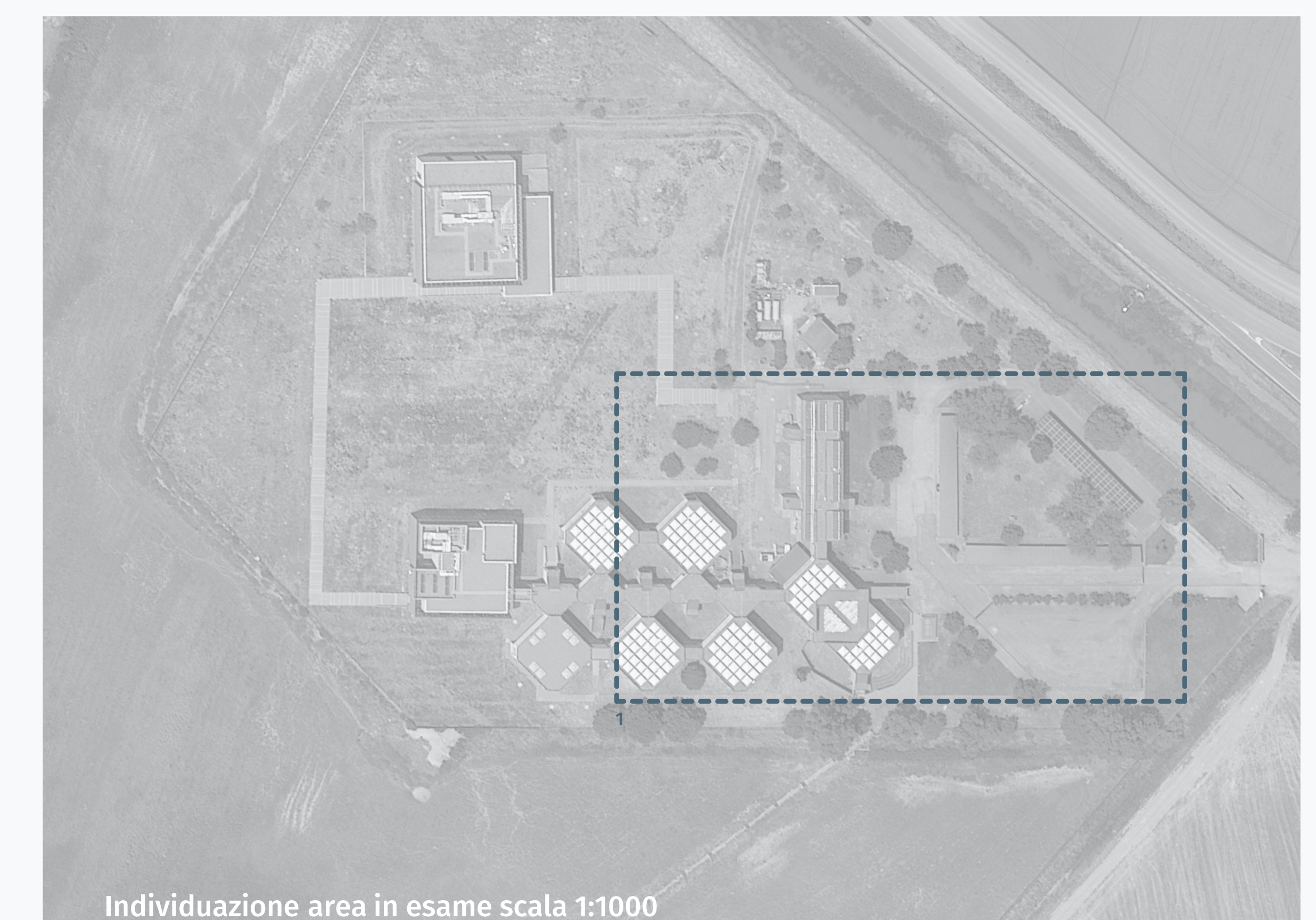
Individuazione area in esame scala 1:1000